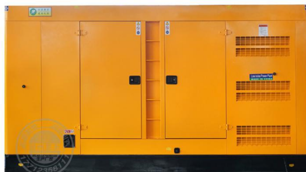
静音型机组（需选装）