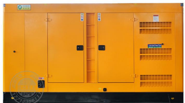
静音型机组 (需选装)