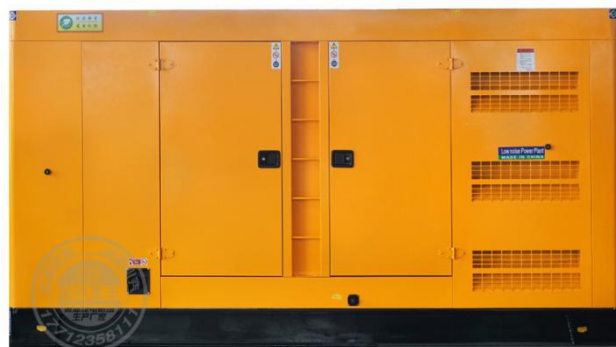
静音型机组（需选装）